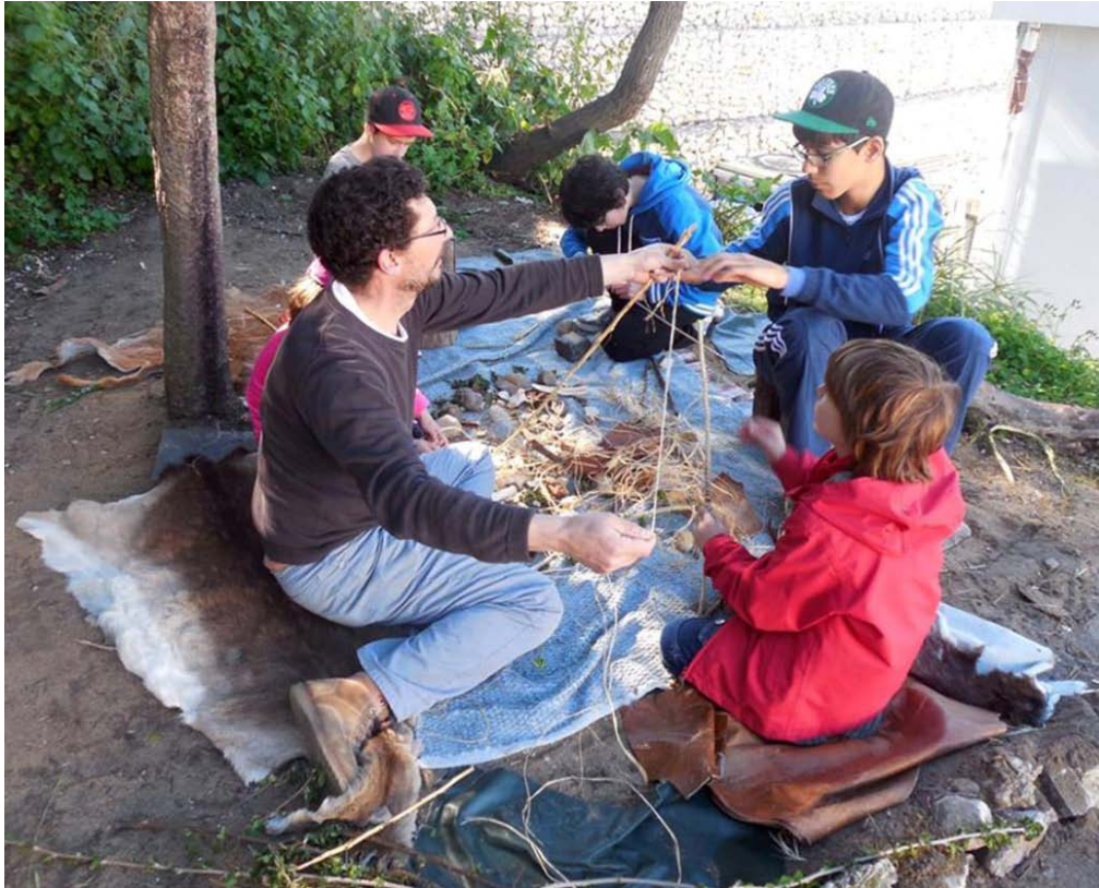
Figura 5. Pormenor de acção de Educação Patrimonial com a temática da Pré-História.