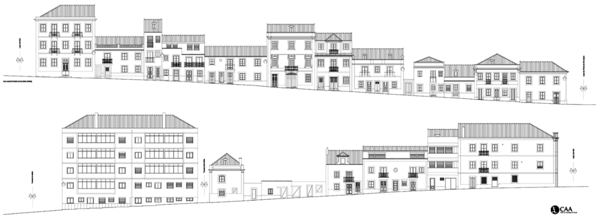
Figura 3. Levantamento arquitectónico de fachadas de uma das ruas do núcleo urbano antigo de Almada.

A intervenção associativa não se limita, contudo, à investigação, conservação, patrimonialização e comunicação de natureza arqueológica. O CAA desenvolve também intensa actividade na área do Património cultural imóvel, ao nível dos levantamentos arquitectónicos e inventários georreferenciados de conjuntos urbanos, criando ferramentas técnicas ao serviço das estratégias para a gestão do território e para a aplicação das metodologias mais adequadas ao registo, documentação, conservação e reabilitação de imóveis e conjuntos de interesse histórico.