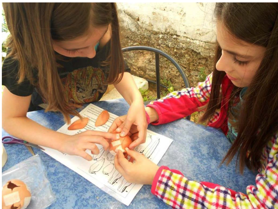
Figura 6. Pormenor de acção de Educação Patrimonial com a temática da romanização.

Noutro plano, beneficiando de parcerias institucionais e da disponibilidade de alguns dos melhores investigadores nacionais, as ofertas de formação especializada são múltiplas e criam oportunidades para que públicos universitários ou com formação e interesses mais específicos aprofundem os seus conhecimentos sobre Arqueologia, estudos de materiais, Conservação, Museologia, Arquitectura, Fotografia, etc. Em 2014, dando seguimento à planificação de anos