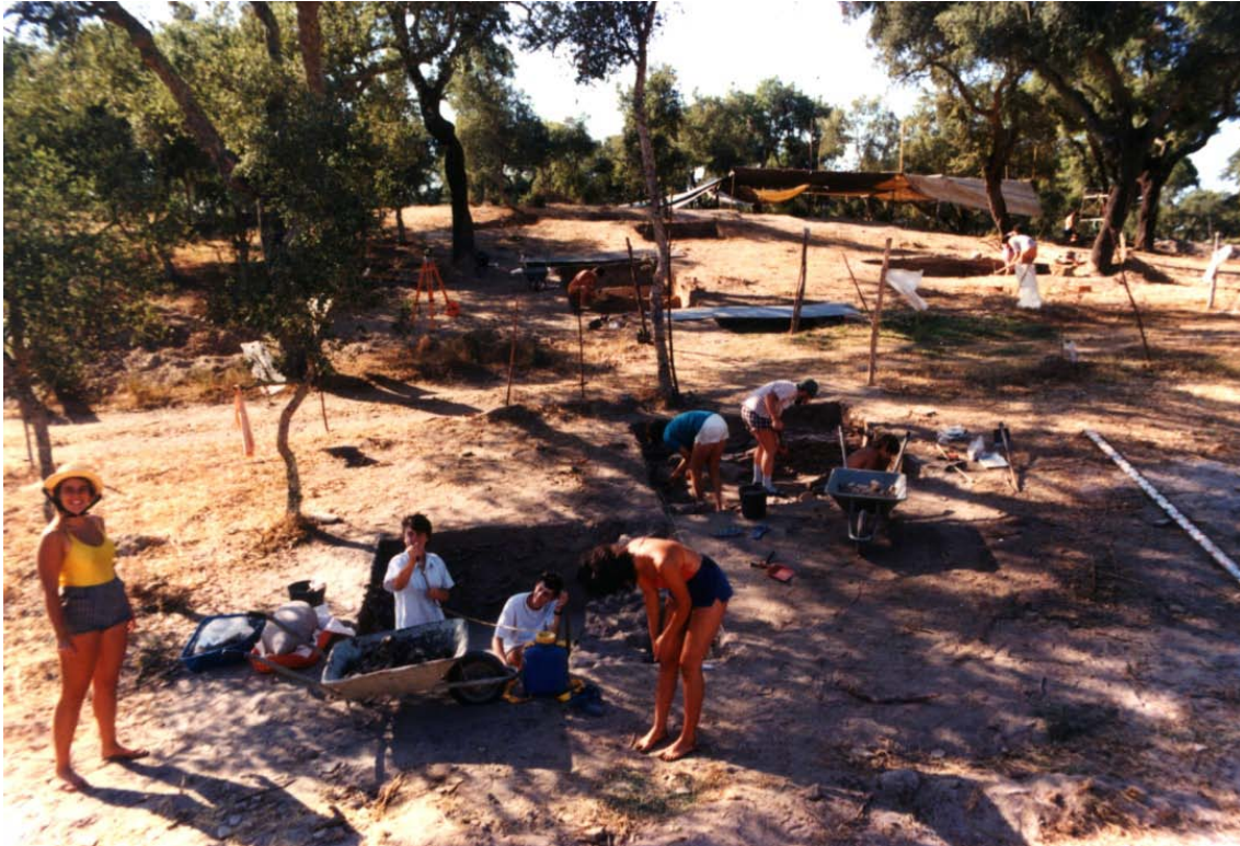
Figura 2. Aspecto dos trabalhos de campo na olaria romana do Porto dos Cacos (Alcochete), realizados entre 1985 e 1990.

A intervenção associativa não se limita, contudo, à investigação, conservação, patrimonialização e comunicação de natureza arqueológica. O CAA desenvolve também intensa actividade na área do Património cultural imóvel, ao nível dos levantamentos arquitectónicos e inventários georreferenciados de conjuntos urbanos, criando ferramentas técnicas ao serviço das estratégias para a gestão do território e para a aplicação das metodologias mais adequadas ao registo, documentação, conservação e reabilitação de imóveis e conjuntos de interesse histórico.