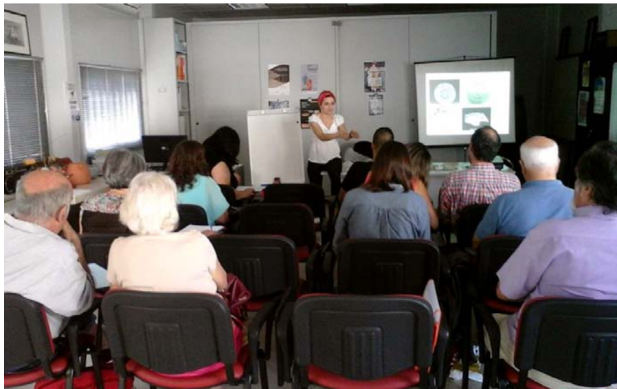
Figura 7. Pormenor de acção de formação especializada realizada na sede social da associação.

anteriores, especialistas convidados sintetizaram o estado do conhecimento sobre as lucernas romanas e a faiança portuguesa, e estimularam a reflexão sobre os espaços e as paisagens no mundo rural romano e a abordagem teórico-metodológica ao inventário de bens arqueológicos.