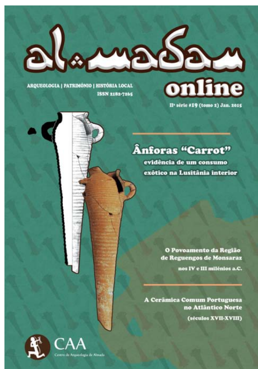
Figura 8. Capas das últimas edições da Al-Madan impressa (ISSN 0871-066X), tendo por tema central a Arqueologia e o Património Industrial, e da revista digital Al-Madan Online (ISSN 2182-7265). Ambas foram concluídas e iniciaram a sua circulação em Janeiro de 2015.