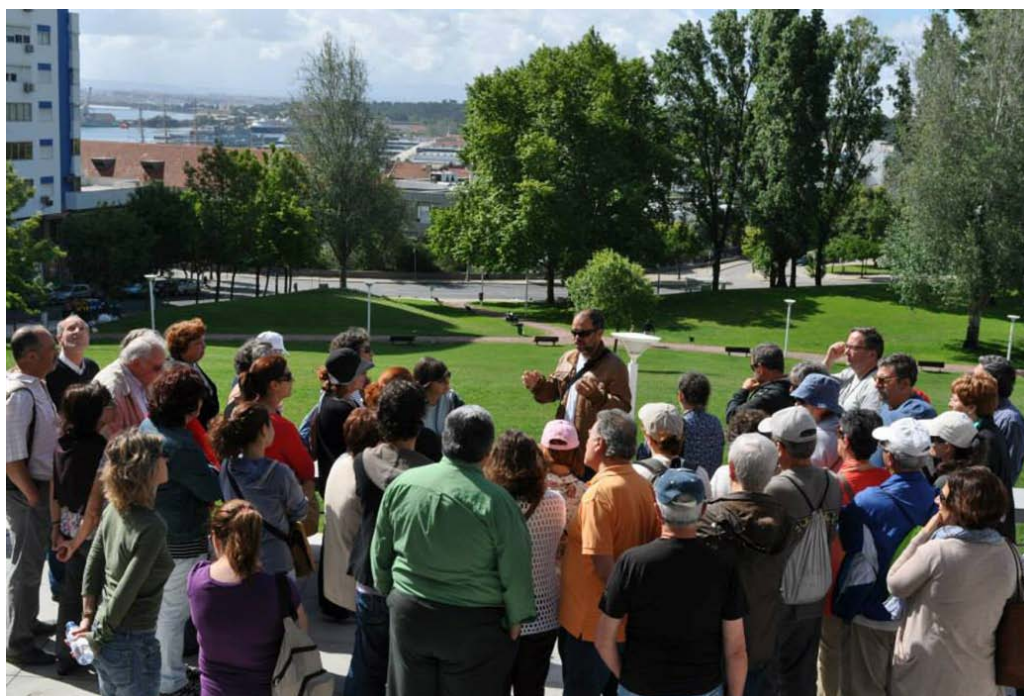
Figura 4. Pormenor de visita guiada.

Esta e outras valências propiciam uma intensa prática de educação patrimonial, traduzida em visitas guiadas, sessões audiovisuais, ateliês e projectos pedagógicos diversos, de natureza formativa e lúdica, frequentemente desenvolvidos em parceria com as comunidades educativas locais. A título de exemplo, no ano de 2014 contabilizaram-se 414 participantes em visitas e passeios temáticos para públicos generalistas e 155 acções pedagógicas, que envolveram 3128 alunos e os respectivos professores. Pelos dados já recolhidos, estima-se que os números de 2015 sejam claramente superiores.